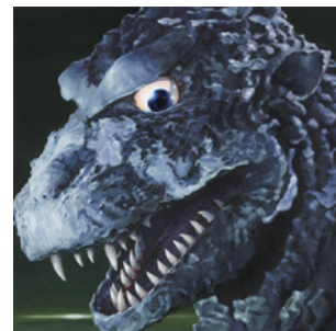
▲「ゴジラ伝説 III」ジャケットイラスト