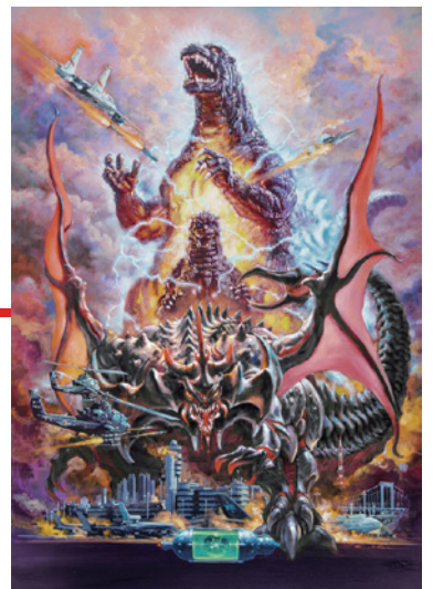
▲「ゴジラVSデストロイア」映画ポスター

ゴジラを描き続けたイラストレーター、生頼範義と開田裕治によるポスター原画やイラスト原画を最大規模で展示。最新描き下ろし、貴重なラフスケッチや橋本満明によるハリウッド版公開ポスター原画も公開。