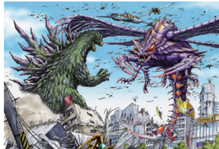
▲「ゴジラ×メカゴジラ G消滅作戦」イメージ画

平成VSシリーズからスタートした西川伸司によるゴジラデザイン。漫画家と云う独自の視点で描き出す作品の数々。最新描き下ろし50点も展示。