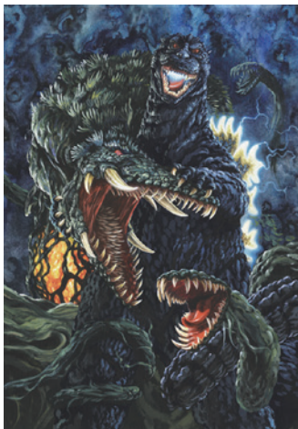
◀「ゴジラ対ビオランテ」月刊誌折込ポスター

ゴジラを描き続けたイラストレーター、生頼範義と開田裕治によるポスター原画やイラスト原画を最大規模で展示。最新描き下ろし、貴重なラフスケッチや橋本満明によるハリウッド版公開ポスター原画も公開。