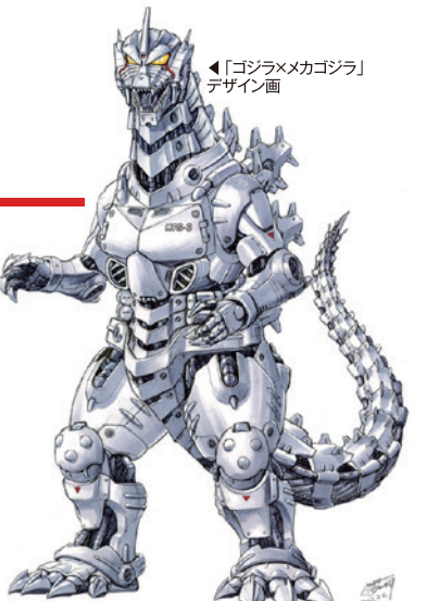
◀「ゴジラ×メカゴジラ」デザイン画

平成VSシリーズからスタートした西川伸司によるゴジラデザイン。漫画家と云う独自の視点で描き出す作品の数々。最新描き下ろし50点も展示。