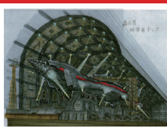
▲「ゴジラ FINAL WARS」新轟天号ドッキングスケッチ

特撮映画を支える美術監督の井上泰幸と三池敏夫。師弟による昭和から新世紀までゴジラシリーズの特撮美術舞台裏を貴重な当時の資料と解説で紹介。