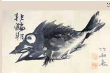
【図版】1. 黒崎研堂 秋風辞「秋風起白雲飛…」荘内南洲会蔵／2. 松平穆堂 一文字「虎」(篆書)個人蔵／3. 土屋竹雨「魚図」致道博物館蔵／4. 松平穆堂 二文字「鳳鳴」(篆書)個人蔵／5. 土屋竹雨 一行書「大道無門千差有路」致道博物館蔵